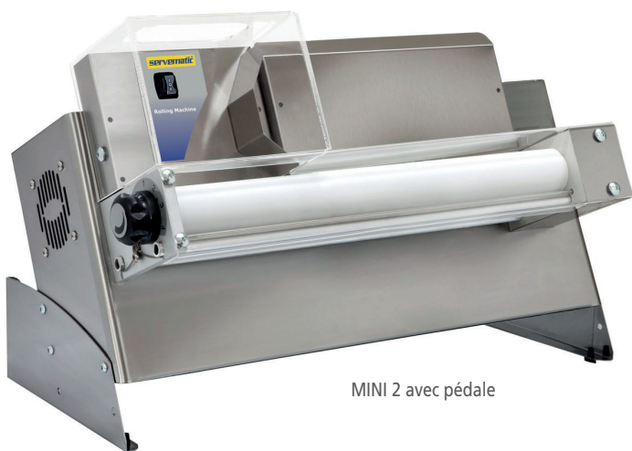
MINI 2 avec pédale

MINI 2 : Permet de produire des fonds de diamètre 30 en 2 passages sans changer le réglage d'épaisseur, grâce à un rouleau dont une partie est d'une section réduite.