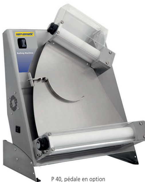
P 40, pédale en option