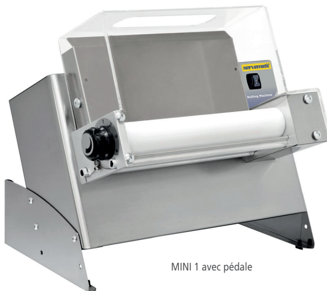
MINI 1 avec pédale