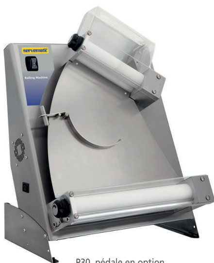
P30, pédale en option