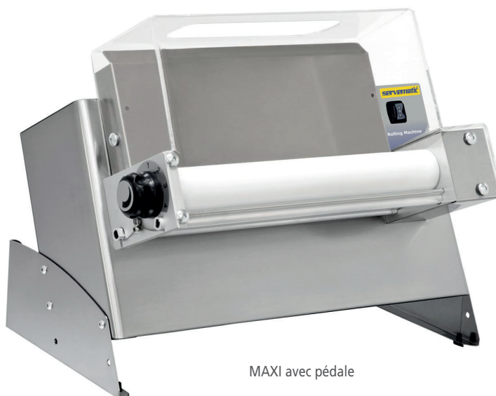
MAXI avec pédale

MINI 2 : Permet de produire des fonds de diamètre 30 en 2 passages sans changer le réglage d'épaisseur, grâce à un rouleau dont une partie est d'une section réduite.