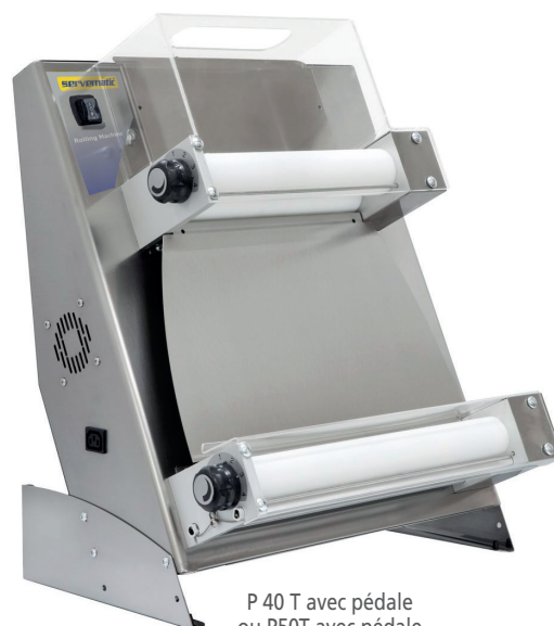
P 40 T avec pédale ou P50T avec pédale